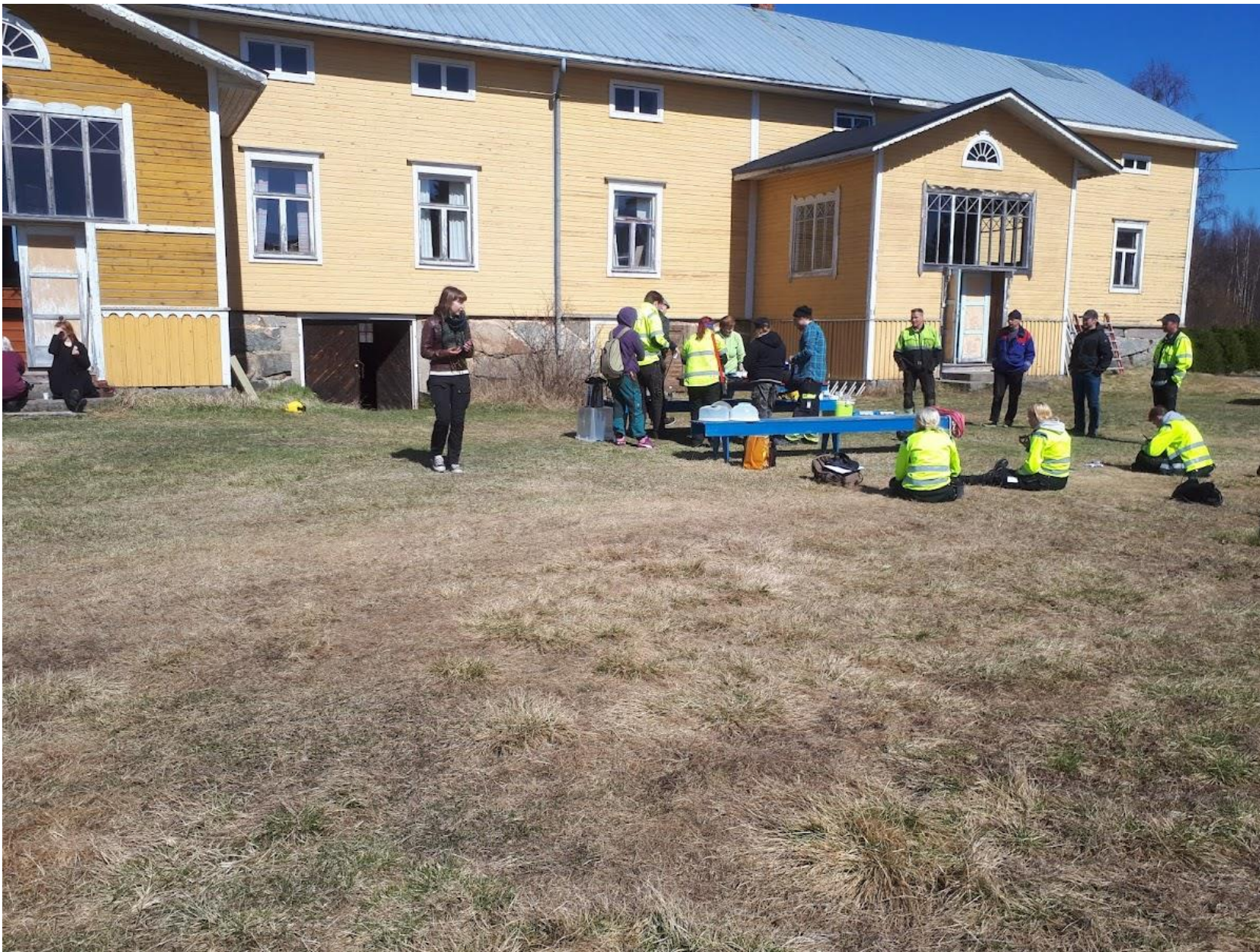
Avoimet miljööt ja komeat kuistit-hankkeen opiskelijat tauolla 23.5.2022.