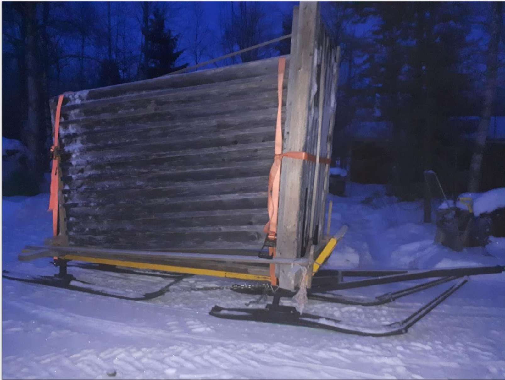
Huussin kuljetus saareen.