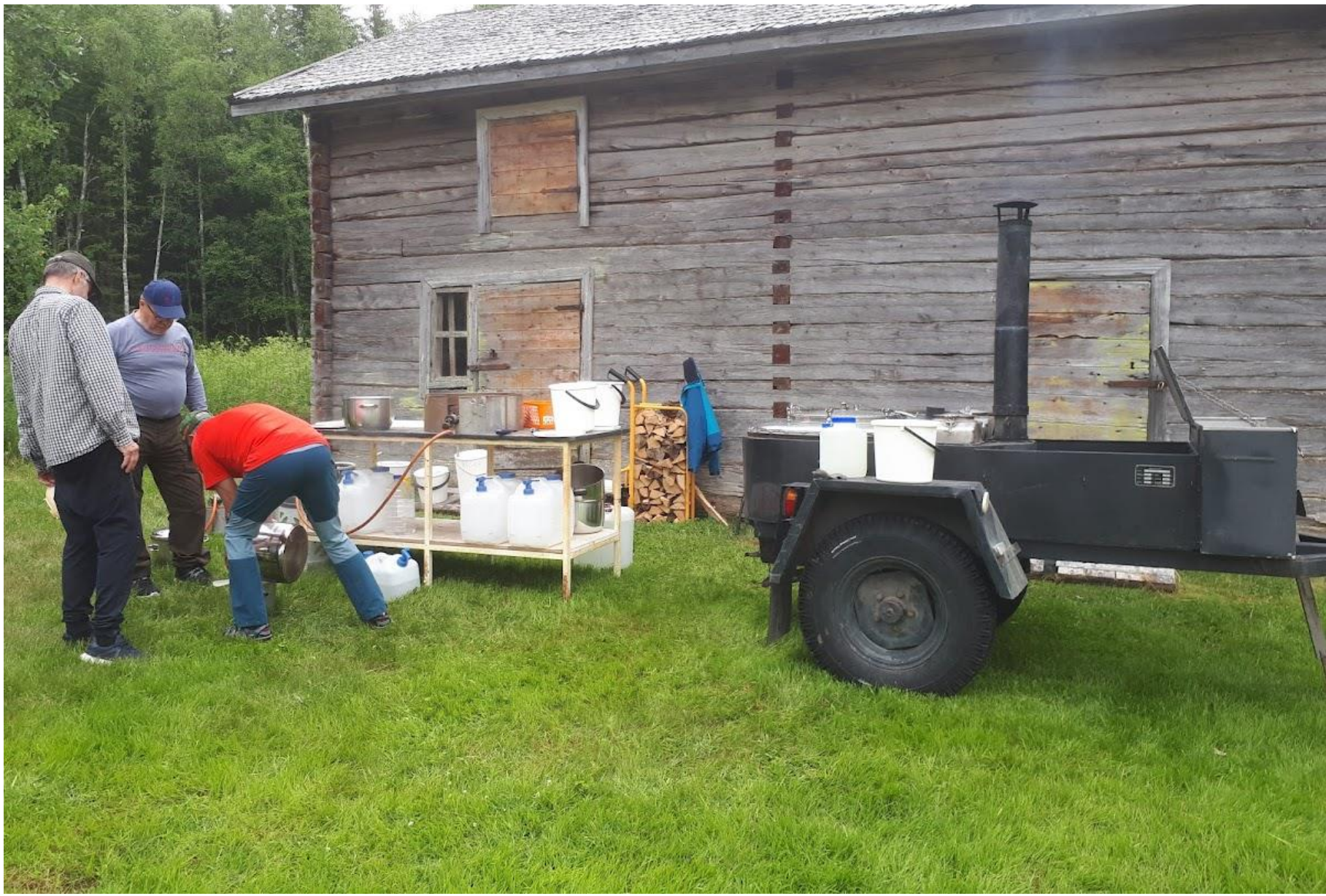
Perinneruokapäivä Pahnilan museolla 3.7.2023