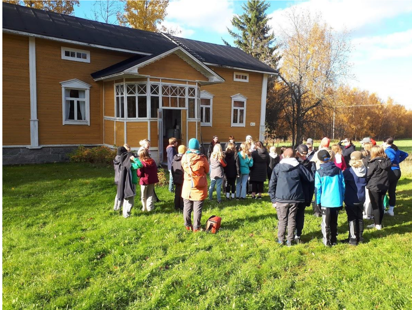
Vieraita Pahnilan museolla.