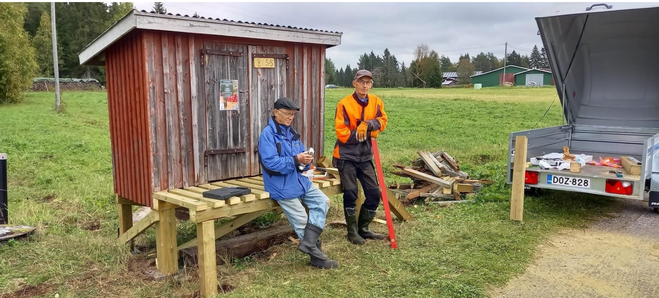
Onkalonperällä maitolaiturin kunnostusta.