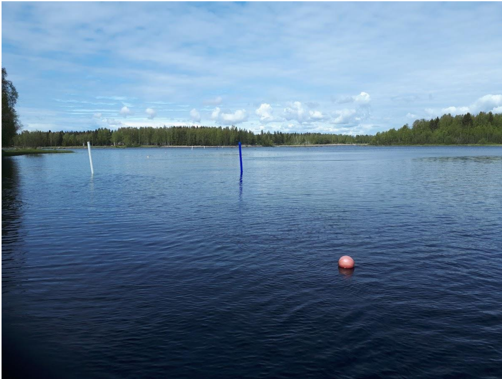
Talvella kaivettu Pikkuhaaran väylä viitoitettuna.