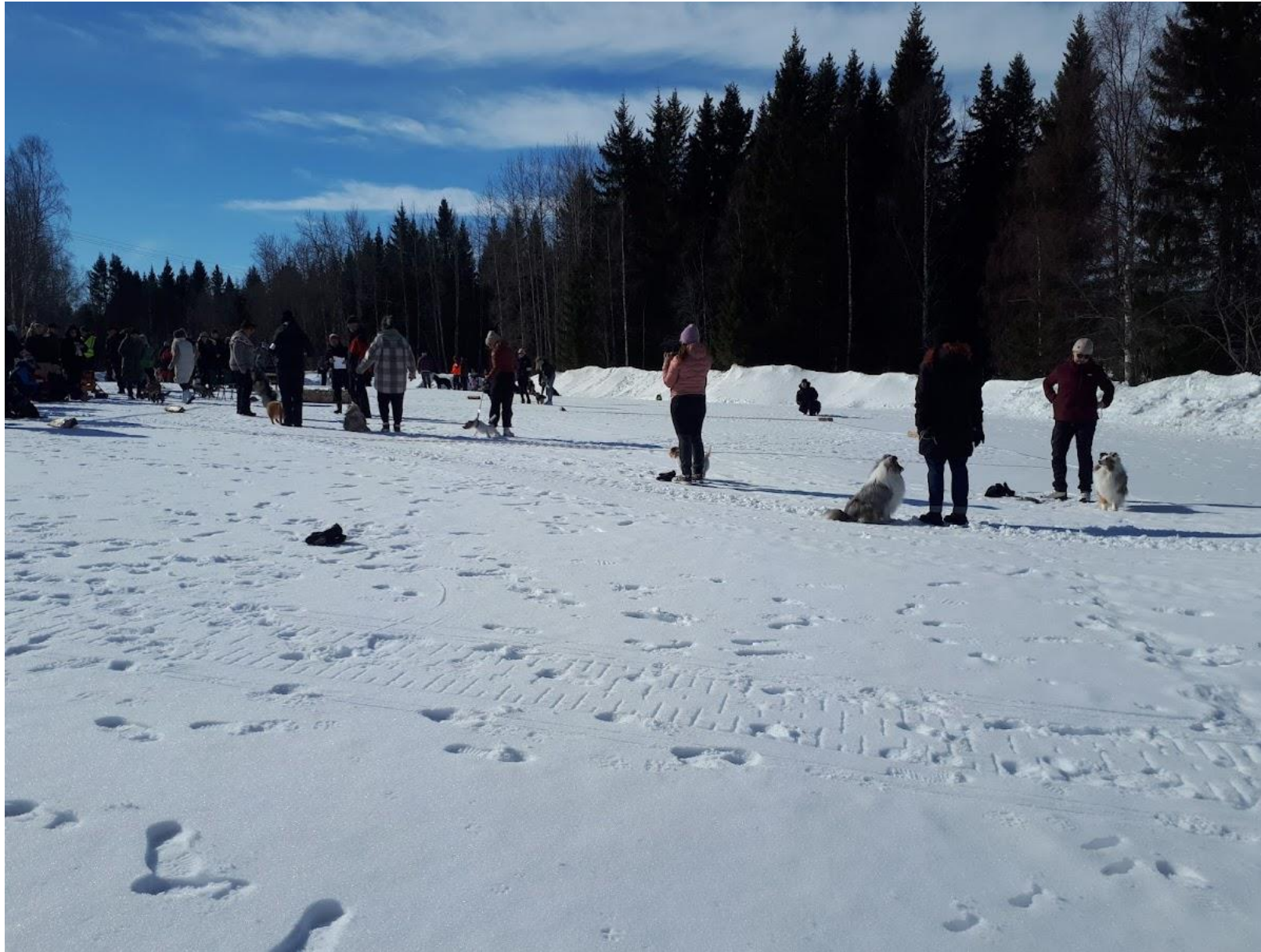
Valjakkokoirakilpailu n.10km valjakkouralla.