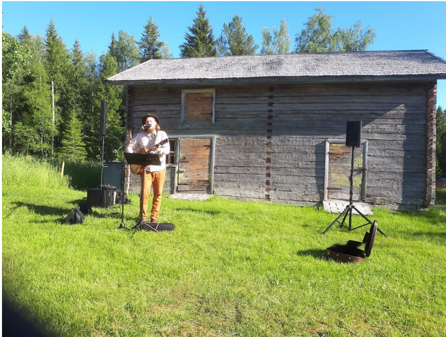
Pahnilan museon avajaiset – Avoimet kylät päivä 10.6.2023.