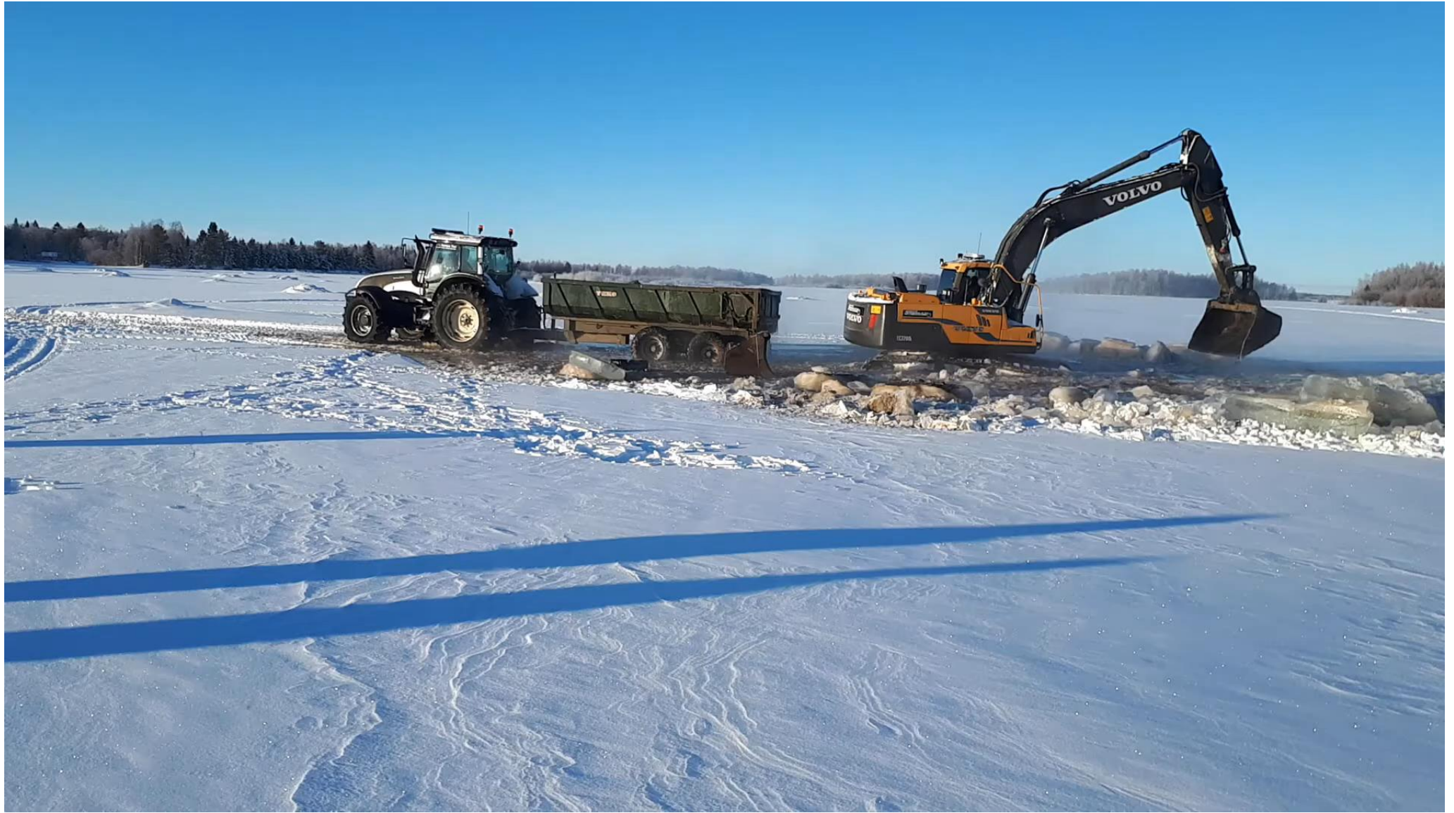
Simojokisuun etelähaaran, ns. Pikkuhaaran väylän ruoppausta.