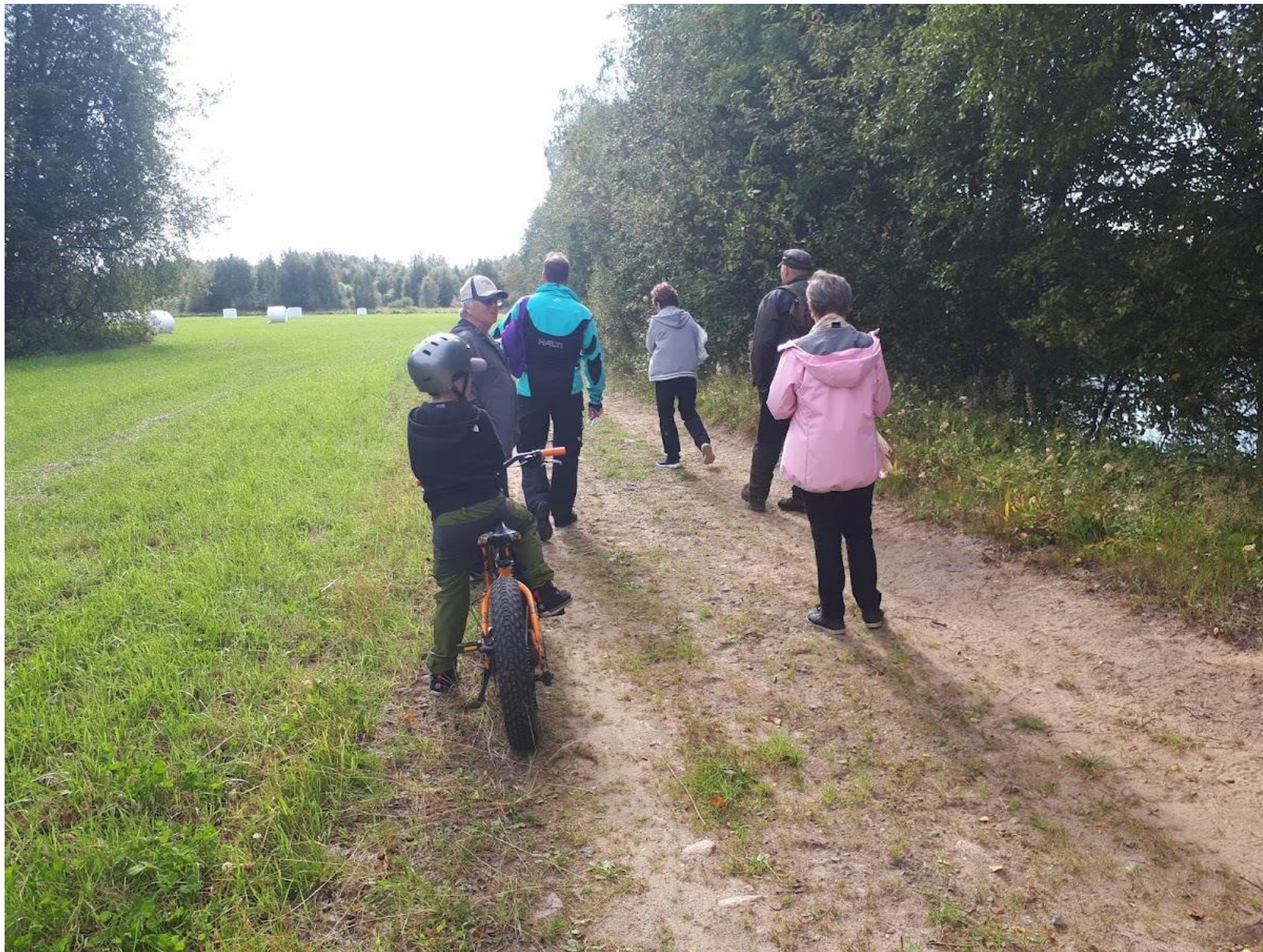
Luontopolun kuntokartoitusta 26.8.2023.