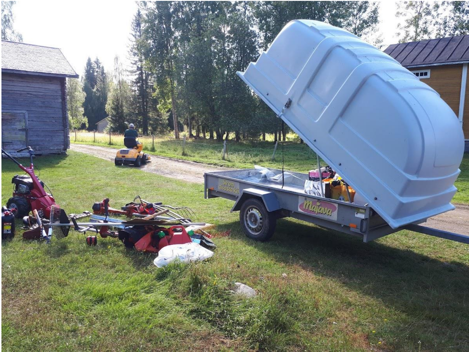
Osa kyläyhdistyksen maisemanhoitokalustosta.