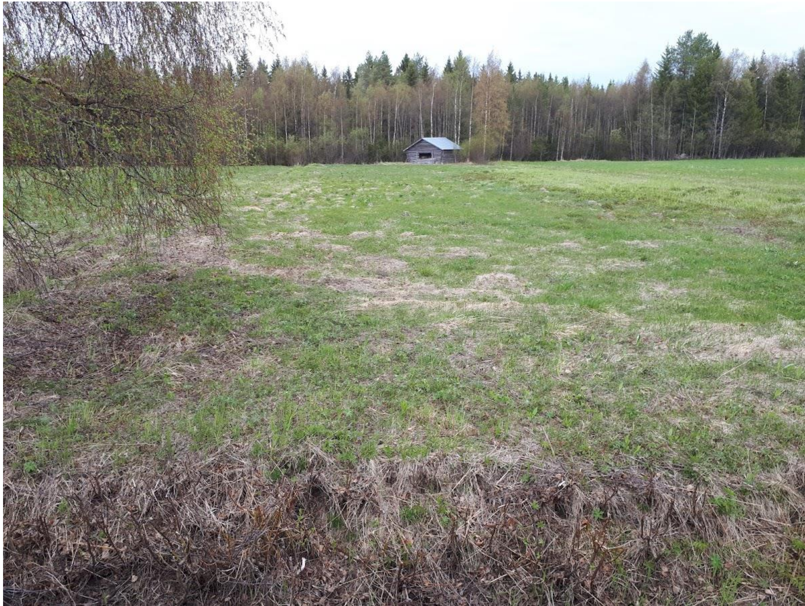
Auringonkukkaketo ennen maanmuokkausta.